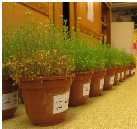
Abb. 3 – Kresse zum Zeitpunkt der zweite Beurteilung