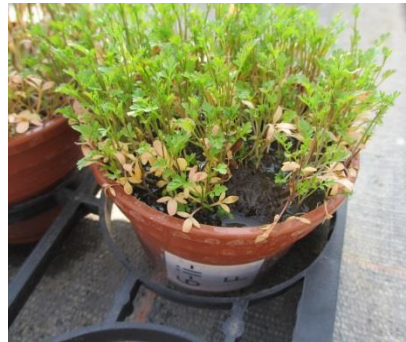
Fig. 2 – Fertilisation du Cresson