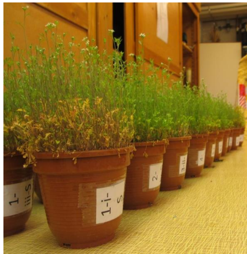
Fig. 3 – Cresson au moment de la deuxième évaluation

Nous n'avons pas relevé de signes de mortalité des racines. Par contre, les plantes ne réagissent pas de la même manière avec les différents engrais de ferme.