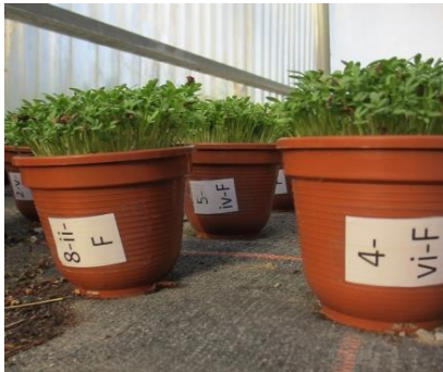
Fig. 1 – Le Cresson une semaine après le semis

Dans les essais de fumure à Grangeneuve, les racines des plantes de prairies ont parfois montré des réactions de dépérissement après épandage de lisier, ou suspecté comme tel. Un test de cresson dans des pots a été réalisé afin de découvrir si différents lisiers et produits de méthanisation peuvent être responsables de ces réactions.